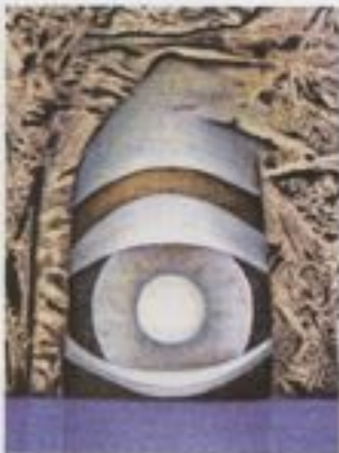
The faded fortissimo of the years (Particolare)

di insegnamento; nel 1982 ha fondato la classe di acquaforte nella scuola di pittura Kronberg dove ha insegnato per quattro anni. Nel giugno 2009, in occasione della Medial Art Biennial, organizzata da "Art Addiction Medial Museum - London" ha ricevuto il prestigioso premio "Diploma di Eccellenza" per il suo lavoro The faded fortissimo of the year dal ciclo Musil Paraphrases 2 dalle mani di Petru Russa.